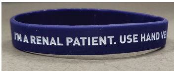
Wear a BC Renal wristband