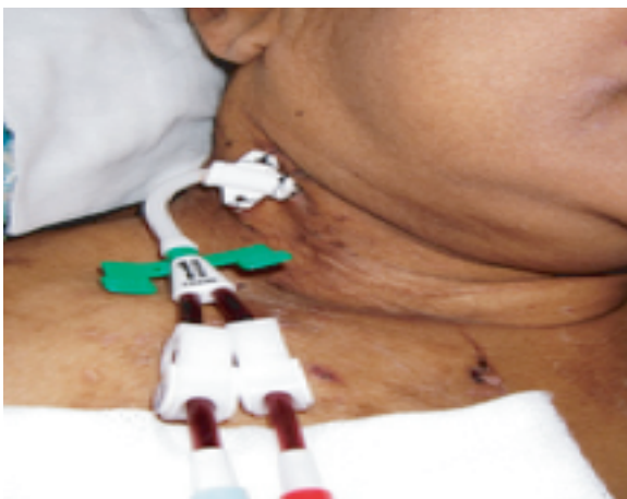
ਧੌਣ ਵਿਚ ਹੋਮੋਡਾਇਲਿਸਿਸ ਕੈਥੇਟਰ

ਨਾੜਾਂ ਤਕ ਪਹੁੰਚ ਲਈ ਕੈਥੇਟਰ ਪਹਿਲੀ ਚੋਣ ਨਹੀਂ ਹੈ। ਇਸ ਵਿਚ ਗਰਾਫਟ ਤੇ ਫਿਸੁਲੇ ਨਾਲੋਂ ਲਾਗ ਤੇ ਖਰੀਡ ਦੀਆਂ ਸਮੱਸਿਆਵਾਂ ਵਧੇਰੇ ਹਨ। ਇਹ ਜ਼ਿਆਦਾ ਸਮਾਂ ਵੀ ਨਹੀਂ ਚਲਦੇ। ਇਕ ਕੈਥੇਟਰ ਤੁਰੰਤ ਵਰਤ ਸਕਦੇ ਹੋ ਜੋ ਫਿਸੁਲਾ ਜਾਂ ਗਰਾਫਟ ਬਣਨ ਤਕ ਇਹ ਕੰਮ ਕਰ ਸਕਦਾ ਹੈ।