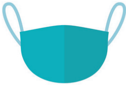
Use a mask