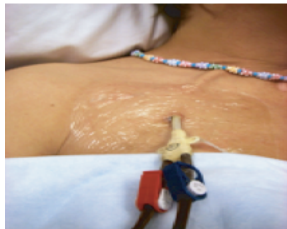
ਛਾਤੀ ਵਿਚ ਵਿਚ ਹੋਮੋਡਾਇਲਿਸਿਸ ਕੈਥੇਟਰ