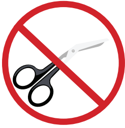
Don't use sharp objects near catheter tubing