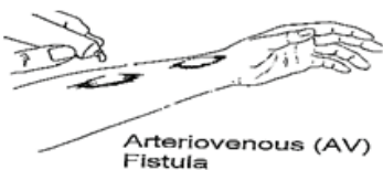
Arteriovenous (AV) Fistula