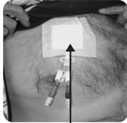
ਡਾਇਲਿਸਿਸ ਕੈਥੇਟਰ ਦੀ ਪੱਟੀ