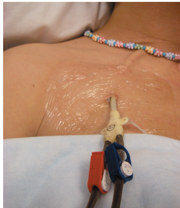
Hemodialysis Catheter sa Dibdib